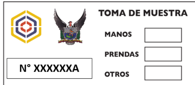
Imagen 4. Etiqueta identificativa para cada STUB