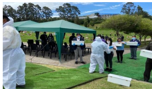
Inicio del proceso