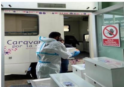
Traslado de féretros

A continuación se muestran algunas fotografías del proceso de inhumación en la ciudad de Quito: