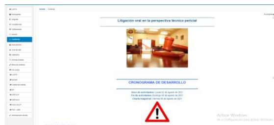
Taller: “Capacitación Litigación oral en la persp. técnico pericial”