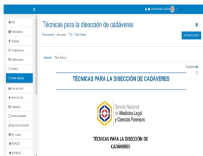
Taller: “Técnicas para la disección de cadáveres”