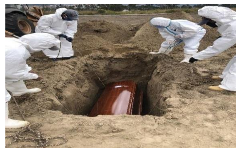
Colocación en las fosas

A continuación se detalla en la siguiente tabla, la cantidad de inhumaciones realizadas en cada provincia: