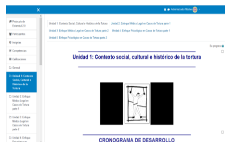
Taller: “Secuelas físicas y psicológicas de la tortura, en el marco del protocolo de Estambul”

Además se procedió a dar asesoría metodológica para el desarrollo de la capacitación sobre delitos mineros, la misma que fue desarrollada por la Fiscalía General del Estado, y que contó con la intervención de varias instituciones públicas a nivel nacional. La capacitación se denominó: “Delitos contra la naturaleza y obtención de la prueba en materia medio ambiental” , y se desarrolló del 22 al 23 de noviembre de 2021, a través de la plataforma zoom.