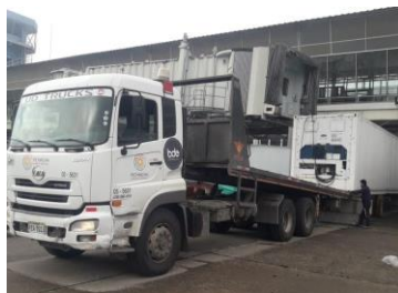
Traslado del Contenedor

En el mes de diciembre de 2021, se realizaron las gestiones con la Empresa Metropolitana EMGIRS para la consecución de una donación, el resultado fue la firma de un Contrato de Comodato o Préstamo de uso Nro. EMGIRS- EP-GGE-CJU-2021-001, para los siguientes bienes: a) Contenedor Refree, b) Sistema de lavado de bandejas, c) Elevador Hidráulico; d) Mesa de elevación. Estos bienes serán utilizados en el área de Patología Forense de Planta Central Quito.