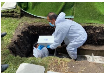
Colocación de féretros