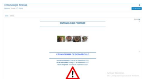
Taller: “Capacitación Entomología Forense”